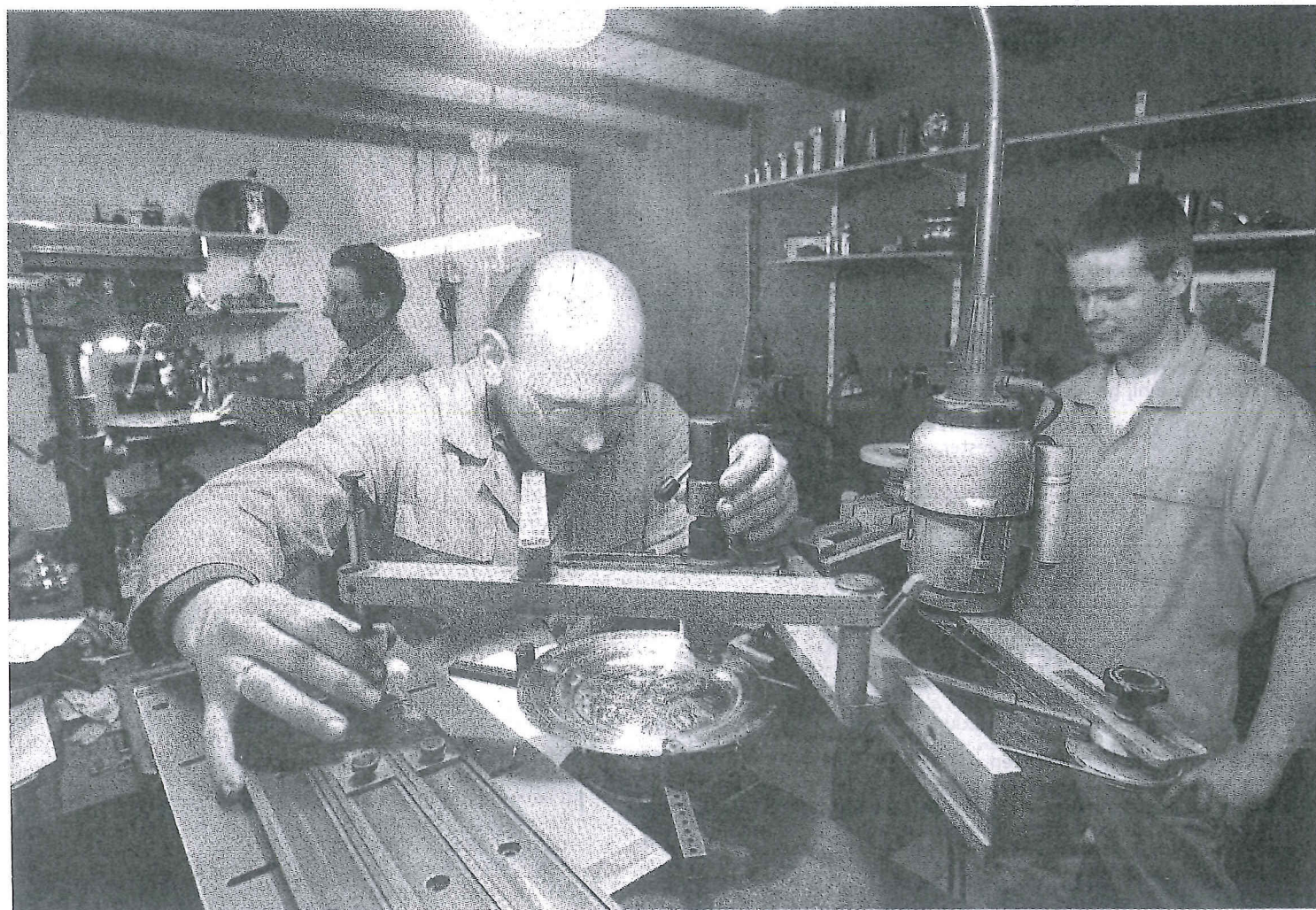
Het personeel van tinfabriek Rio gaat onvermoeid door met het draaien van tin, ondanks de donkere wolk van het faillissement die het werk overschaduwet.

De laatste jaren kalft het af. Internationale ontwikkelingen dienen de toestroom van toeristen een finke klap toe. Onder het personeel gaan al de geruchten over een doorstart, maar of Rio dit laatste failliet te boven kan komen, moet in de komende weken duidelijk worden.